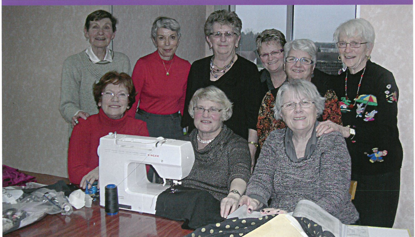
Atelier couture (activité du Foyer rural)