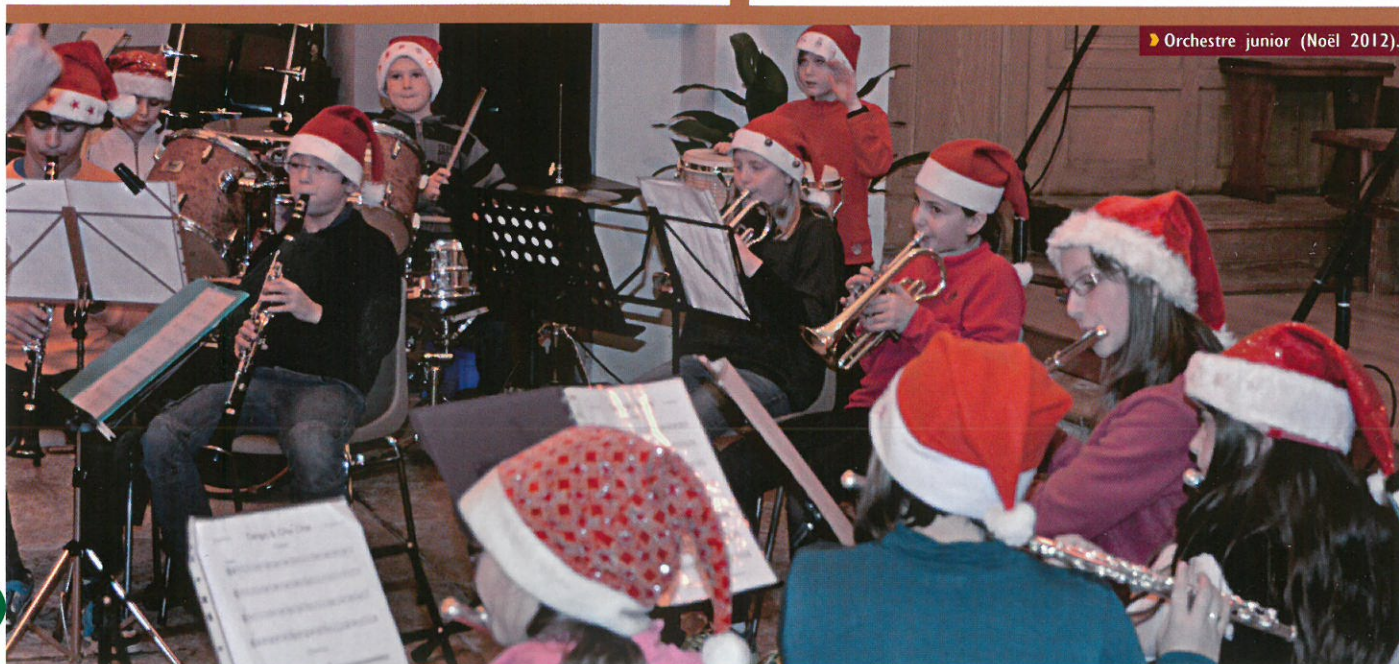
► Orchestre junior (Noël 2012).