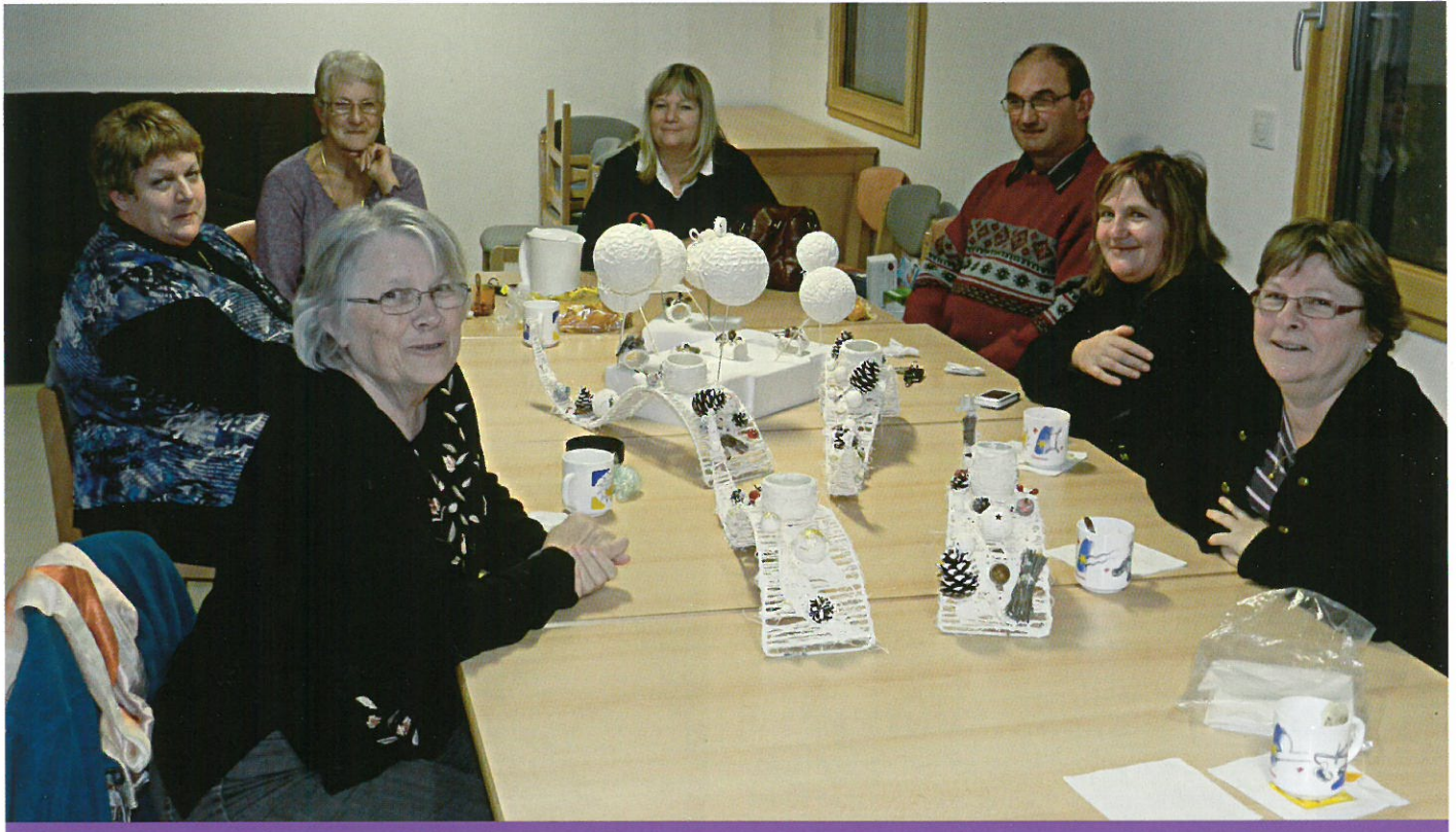
Atelier créatif (activité du Foyer rural)