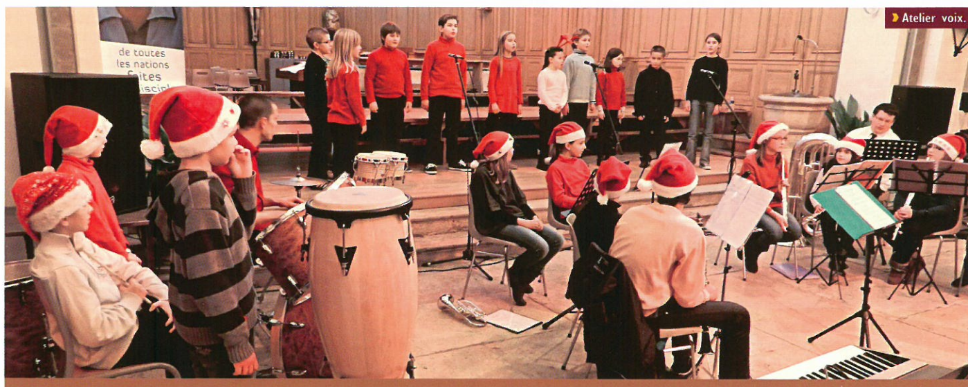
► Atelier voix.